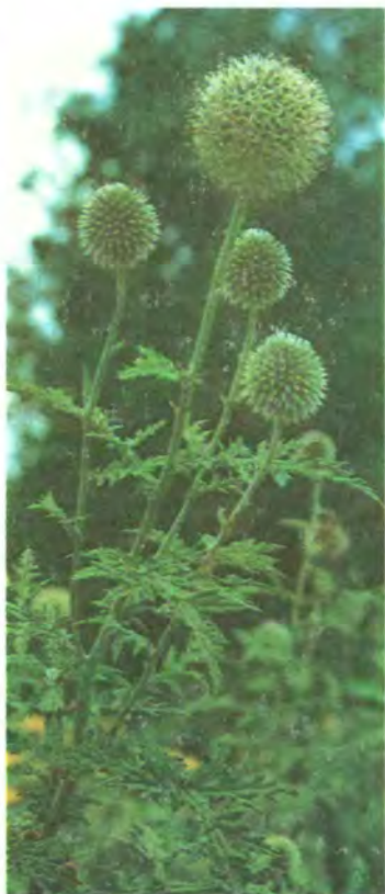
431. Головатень круглоголовий.